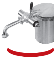
Doseur manuel et cornet coudé

Manual portionner and bent with antidrop valve