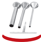
Accessoires inox 18/10

Manual portionner and bent with antidrop valve