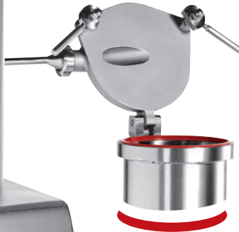
Couvercle ouvert Lid open