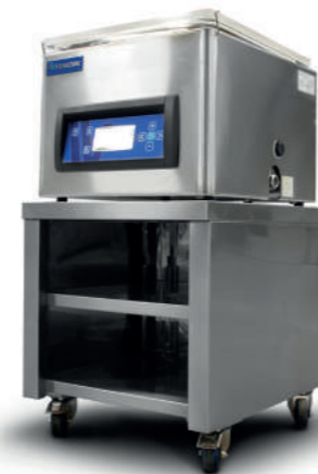
CABINET POUR T2, T3 & T4