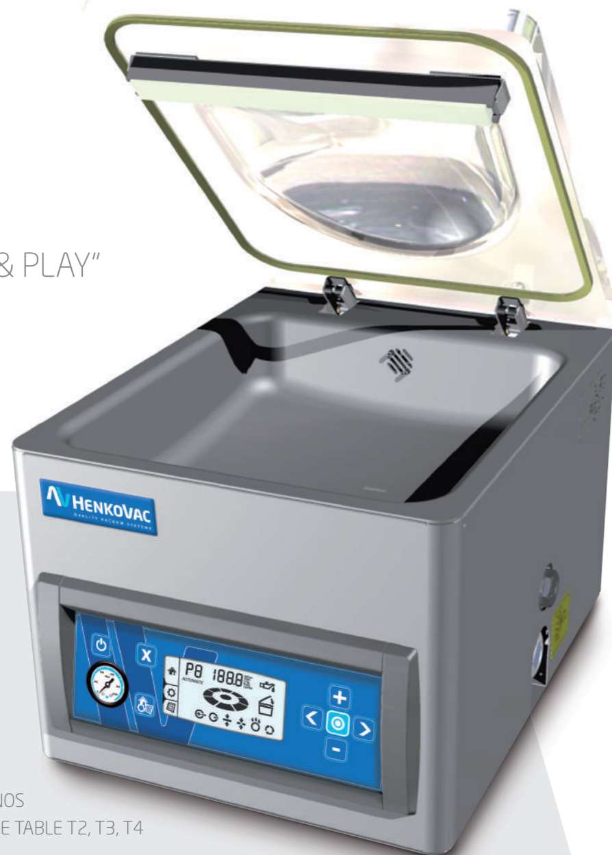
GAMME DE NOS MACHINES DE TABLE T2, T3, T4