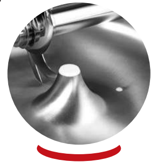
Bouchon pour vidange de la cuve Plug for the unloading of bowl