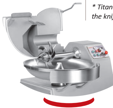
Finition parfaite angle arrondi Perfect completion round angles