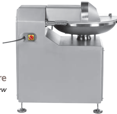
Vue arrière Rear view

* Titane 45 with variator on the knife motor.